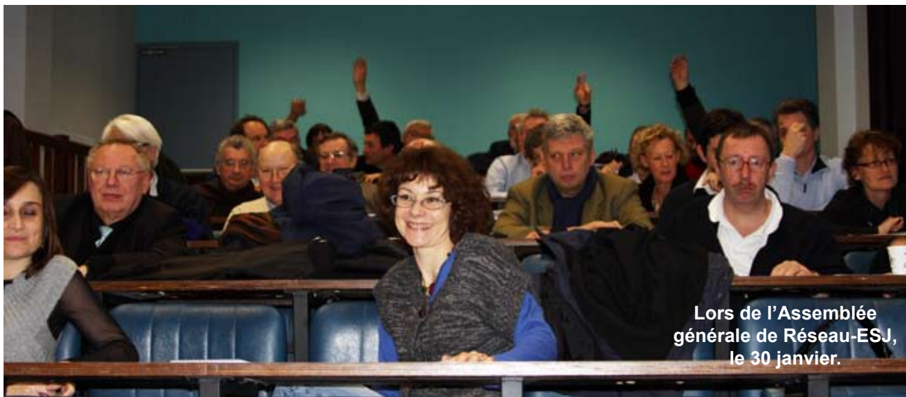
Lors de l'Assemblée générale de Réseau-ESJ, le 30 janvier.

Réseau-ESJ a tenu sa traditionnelle assemblée générale fin janvier. Avenir de son journal, Bourse Fontaine, élection des représentants à l'AG de l'ESJ... Tour d'horizons des projets 2010